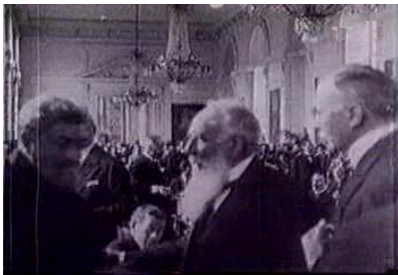
Gróf Apponyi Albert magyar főtárgyaló

A Magyarországra kényszerített trianoni béke nagyon súlyos rendelkezéseket tartalmazott. Az ország elveszítette területének kétharmadát és lakosságának közel 60 százalékát. A Kárpát-medencében élő minden harmadik magyar- több mint hárommillió fő -valamelyik szomszédos állam polgára lett. A hadsereg létszámát és fegyverzetét oly mértékben korlátozták, hogy az egy komolyabb támadással hadsereg létszámát és fegyverzetét oly mértékben korlátozták, hogy az egy komolyabb támadással szemben nem tudta volna megvédeni az országot. Magyarország - amely korábban az Osztrák-Magyar Monarchia részeként az európai nagyhatalmak sorába tartozott - közép-európai kis állammá vált, és katonailag, gazdaságilag kiszolgáltatott helyzetbe került. A magyar kormány ezért kezdettől fogva a trianoni béke megváltoztatására, revíziójára, azaz felülvizsgálatára törekedett