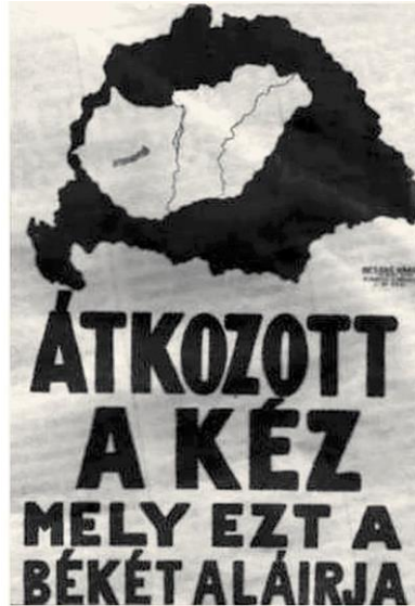
Átkozott a kéz, mely ezt a békét aláírja. Plakát 1920 májusából

A népszavazást 1921. december közepén rendezték meg. A csak a német kancellár - Adolf Hitler - tudta megígérni Magyarország lakossága kétharmada Magyarországra szavazott. 1922- számunkra, hogy revideálja a ben a Nemzetgyűlés törvényben Trianoni békediktátumot, ismerte el a „soproni népszavazási Magyarország politikailag terület lakosságának a magyar elkötelezte magát Hitler oldalán. állam iránt tanúsított Ennek köszönhetően, illetve az tántoríthatatlan hűségét”, Sopron első - második bécsi döntésekkel, városának címerét pedig a civitas Kárpátalja megszállásával és a fidelissima (civitasz fidelisszima, Délvidék egy részének leghűségesebb város) jelisével visszacsatolásával - a hitleri Németség támogatásának köszönhetően - összesen mintegy 80 ezer km 2 -nyi területet tudott visszaszerezni Magyarország. Újra a miénk lett a Felvidék déli része, Erdély északi fele, Kárpátalja és a Délvidék egy szelete. A Trianon előtt még 325 411 km 2 nagyságú (Horvátországgal együtt értendő) hajdani Nagy-Magyarországtól igazságtalanul elvett 232 ezer km 2 -nyi területnek 35% -a újra hazánk birtokába kerülhetett! A lakosságot tekintve a visszacsatolt részekkel 5 millió fővel